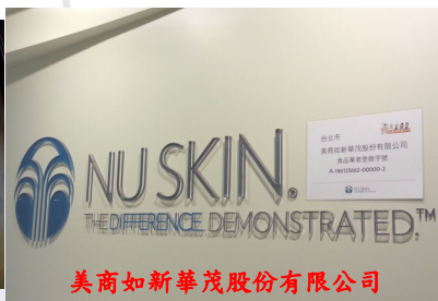
美商如新華茂股份有限公司